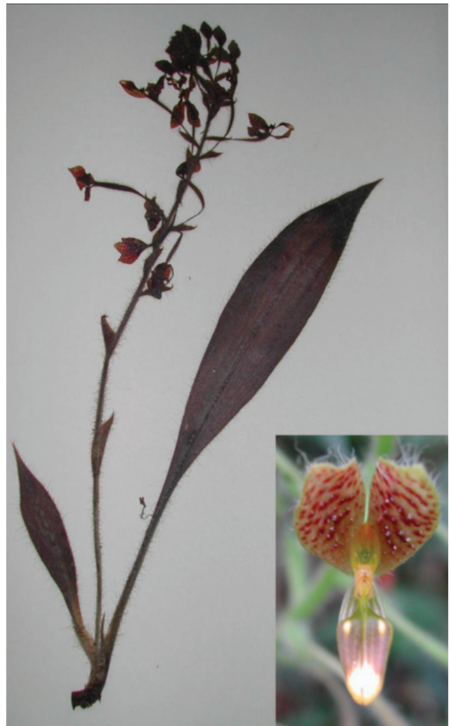
Figura 2. Ejemplar de Ponthieva brenesii (G. Castillo C. et al. 21370), y acercamiento de una flor.

El género Piper tiene aproximadamente 2 000 especies pantropicales (Mabberley, 1997), y de todas las especies americanas sólo 8 presentan el hábito trepador (Tebbs, 1989). En el estado de Veracruz se han registrado casi 90 especies (Sosa y Gómez-Pompa, 1994), aunque ninguna con hábito trepador. Piper xanthostachyum (Fig. 3) es una planta trepadora sobre troncos de árboles, alcanza hasta 15 m de altura, sus tallos son glabros, con ramas nudosas y