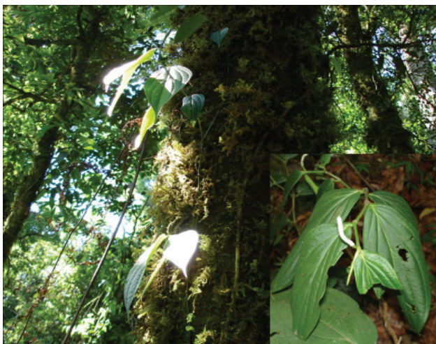
Figura 3. Piper xanthostachyum (G. Castillo C. et al. 21359) en el bosque mesófilo de La Cortadura, Veracruz (Fotos G. Castillo).

al raquis, y de la segunda porque sus inflorescencias no son rosadas o moradas ni opuestas a las brácteas florales (Tebbs, 1989). Además, ninguna de las 2 especies alcanza en su distribución a México (Tebbs, 1989), mientras que P. xanthostachyum es una especie común en los bosques mesófilos de montaña de Costa Rica y Guatemala (Standley y Steyermark, 1952), y también se ha registrado en El Salvador, Nicaragua, Panamá y Ecuador (Tebbs, 1989; Flora Mesoamericana, 2007). En México P. xanthostachyum se conoce de Oaxaca y Chiapas donde se encuentra entre 1400–2850 m snm (Breedlove 1986). No había sido registrada previamente para el estado de Veracruz, por lo tanto este registro significa una notable extensión de su límite anterior de distribución septentrional.