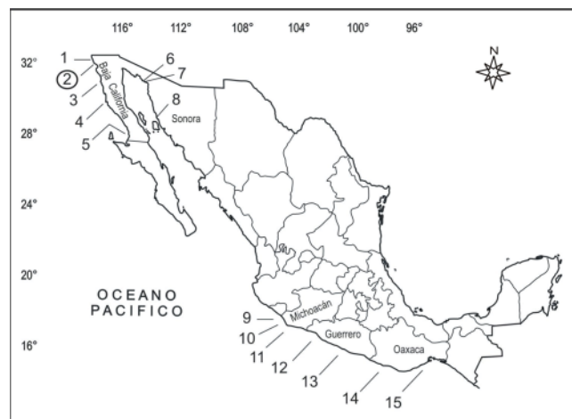
Figura 1. Localización del sitio de muestreo (O) y distribución geográfica de Polysiphonia confusa en la costa del Pacífico de México. 1. Punta Descanso, 2. Playa Saldamando, 3. Cabo Colonet, 4. Punta Baja, 5. Desembarcadero de Miller, 6. Bahía La Cholla, 7. Puerto Peñasco, 8. Desemboque de San Ignacio, 9. Pichilinguillo, 10. Punta San Telmo, 11. Faro de Bucerías, 12. Ensenada de los Presos, 13. El Yunque, 14. Escollera del Puerto de Salina Cruz, 15. Cerro Hermoso y El Zapotal.

Las plantas recolectadas de Polysiphonia confusa fueron de color rojo parduzco, constituidas por ejes postrados enmarañados, fijas al sustrato por rizoides, a partir de los cuales surgen los ejes erectos, con escasas ramificaciones laterales. La altura de los talos osciló entre 0.8-1.2 cm, los ejes postrados con un diámetro de 130-200 µm, fijos al