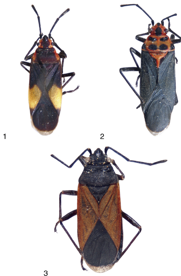
Figuras 1–3. Vista dorsal. 1, Acroleucus colombianus n. sp.; 2, Acroleucus lojus n. sp.; 3, Acroleucus haemopterus Stål.

Esta especie desplaza a la dicotomía 26 de la clave proporcionada por Slater (1992), guardando relaciones con A. caicarensis Brailovsky (1984) y A. tullus (Stål, 1862) por tener los artejos antenales I–III negros, trocánteres amarillos, membrana hemelital pardo oscura con el margen apical translúcida y en forma de media luna, cabeza en vista dorsal total o mayormente negra, márgenes anterolaterales del pronoto amarillos o anaranjado brillantes, margen posterior del pronoto pardo oscuro a negro, disco pronotal sin una franja mesial longitudinal amarilla o anaranjada y tanto el escutelo como el clavus enteramente negros o pardo oscuros. En A. colombianus n. sp. la cabeza en vista