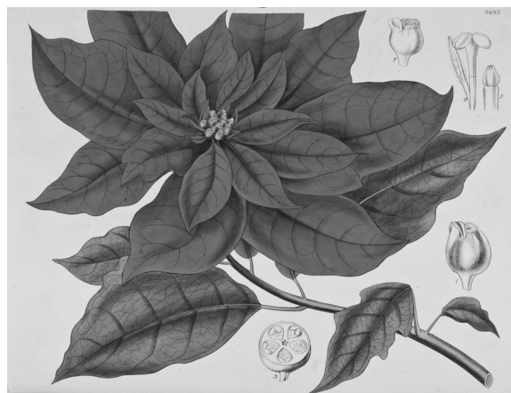
Figura 4. Ilustración botánica de nochebuena descrita como Poinsettia pulcherrima en Graham (1836b).

desde la época prehispánica en lo que es hoy el Distrito Federal (Sahagún, 1979), y la presencia de cultivares mexicanos en la Nueva España se observa en la ilustración de Navarro (1992), en la cual se dibuja una nochebuena con inflorescencias de más de una hilera brácteas (fig. 3). Incluso es posible que Joel Roberts Poinsett se haya llevado plantas con cierto grado de manejo, ya que se observan plantas con inflorescencias dobles en ilustraciones de Graham (1836b) (fig. 4). También es posible que existan variantes novedosas de nochebuena en el Distrito