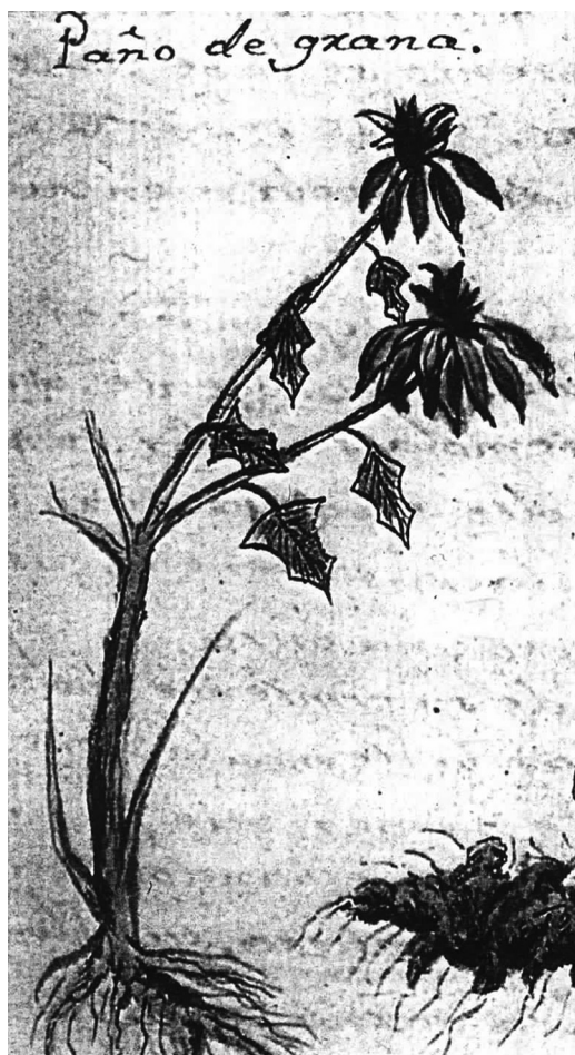
Figura 3. Nochebuena nombrada como «paño de grana» en Historia Natural o Jardín Americano del año 1801 (Navarro, 1992). Ilustración de Euphorbia pulcherrima con inflorescencias dobles.

H : haplotipo; H_d : diversidad haplotípica; k : promedio de número de diferencias nucleotídicas; S : número de sitios segregantes; SD : desviación estándar; \theta_w : diversidad genética; \pi : diversidad nucleotídica.