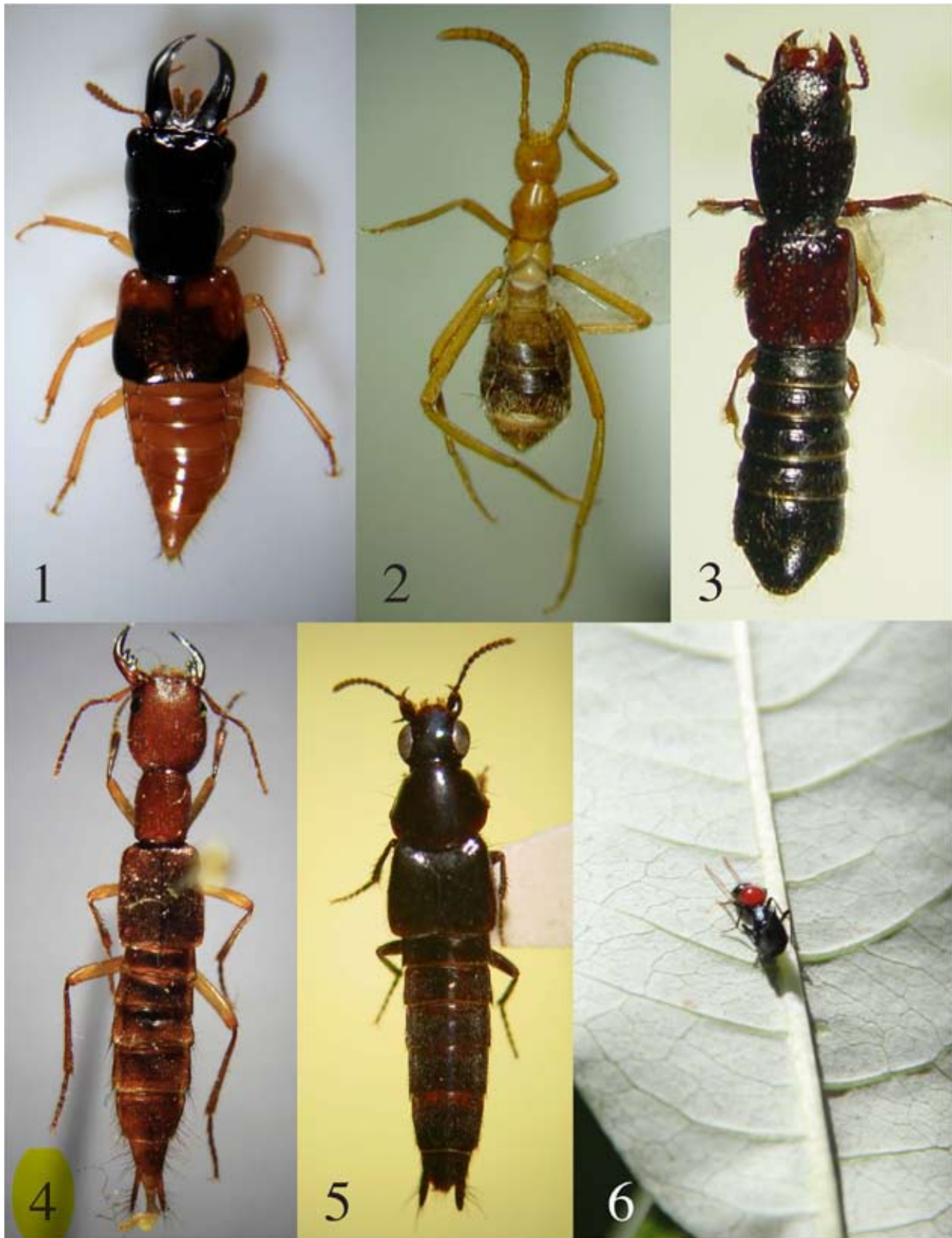
Figuras 1-6. 1, Oxyporus lawrencei Campbell, 1974 (Oxyporinae). 2, Sceptobius schmitti (Wasmann, 1901) (Aleocharinae). 3, Osorius sp. (Osoriinae). 4, Homaeotarsus sp. (Paederinae). 5, Quedius sp. (Staphylininae). 6, Paederus sp. (Paederinae).